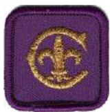
Jack Cornwell Decoration

Les badges de programme/section sont cousus sur la poche droite de l'uniforme des jeunes ainsi que la décoration Jack Cornwell pour comportement exemplaire et courage. Consultez les fiches d'information/uniforme de la boutique Scoute. Le prix de section le plus senior jeunesse est porté sur l'uniforme adulte sur la poche droite.